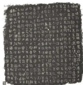
散 氏 盘